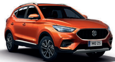
Pomarańczowy „Hoxton Orange” (metalik)