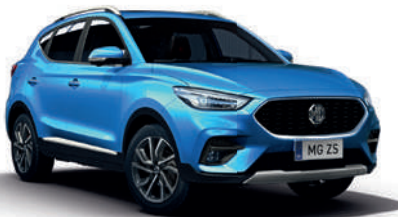
Niebieski „Battersea Blue” (metalik)