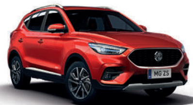
Czerwony „Dynamic Red” (trójwarstwowy)