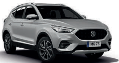
Srebrny „Monument Silver” (metalik)