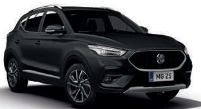
Czarny „Black Pearl” (metalik)