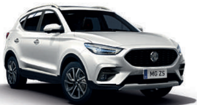
Biały „Arctic White” (standard)